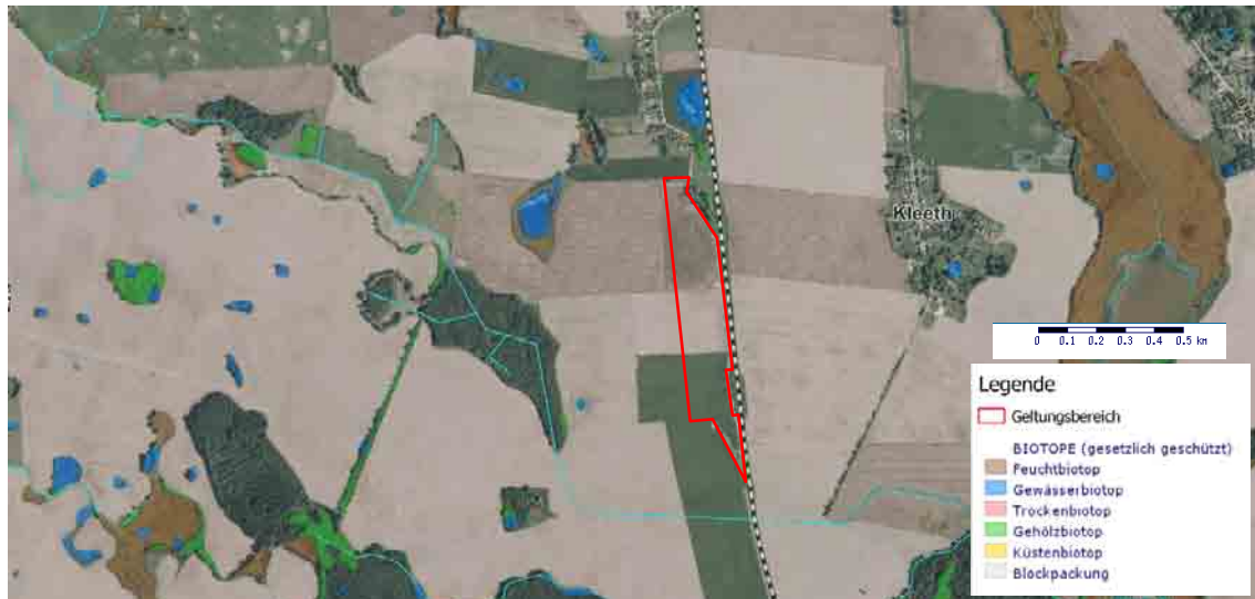
Abbildung 3: Vorhaben (rot umrandet) im Zusammenhang mit geschützten Biotopen.

Abbildung 3 verdeutlicht, dass am Nordostrand des Geltungsbereiches Gehölzbiotope vorkommen. Im Umfeld des Vorhabens sind zudem Gewässer-, Gehölz und Feuchtbiotope vorhanden. Das Plangebiet befindet sich innerhalb des europäischen Vogelschutzgebiets DE 2344-401 (Kuppiges Tollensegebiet zwischen Rosenow und Penzlin) sowie 1.650 m südwestlich des GGB DE 2344-301 (Kastorfer Rinne) und 3 km südwestlich des Landschaftsschutzgebiets LSG 037 (Kastorfer See) (siehe Abbildung 4).