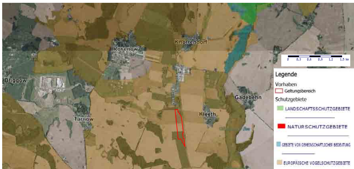
Abbildung 4: Vorhaben (rote umrandete Fläche) im Zusammenhang mit nationalen und internationalen Schutzgebieten. Kartengrundlage: Geoportal M-V 2023.

Abbildung 3 verdeutlicht, dass am Nordostrand des Geltungsbereiches Gehölzbiotope vorkommen. Im Umfeld des Vorhabens sind zudem Gewässer-, Gehölz und Feuchtbiotope vorhanden. Das Plangebiet befindet sich innerhalb des europäischen Vogelschutzgebiets DE 2344-401 (Kuppiges Tollensegebiet zwischen Rosenow und Penzlin) sowie 1.650 m südwestlich des GGB DE 2344-301 (Kastorfer Rinne) und 3 km südwestlich des Landschaftsschutzgebiets LSG 037 (Kastorfer See) (siehe Abbildung 4).